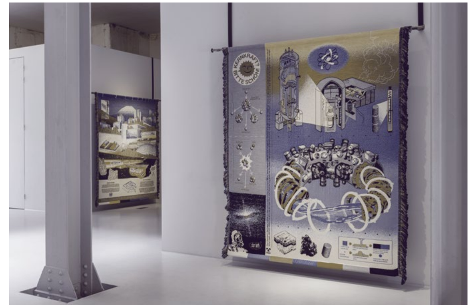
Adam Blechly, Whole Earth Trilogy: Radical Cut-Up , Graduation Show 2019, Looiersgracht 60.