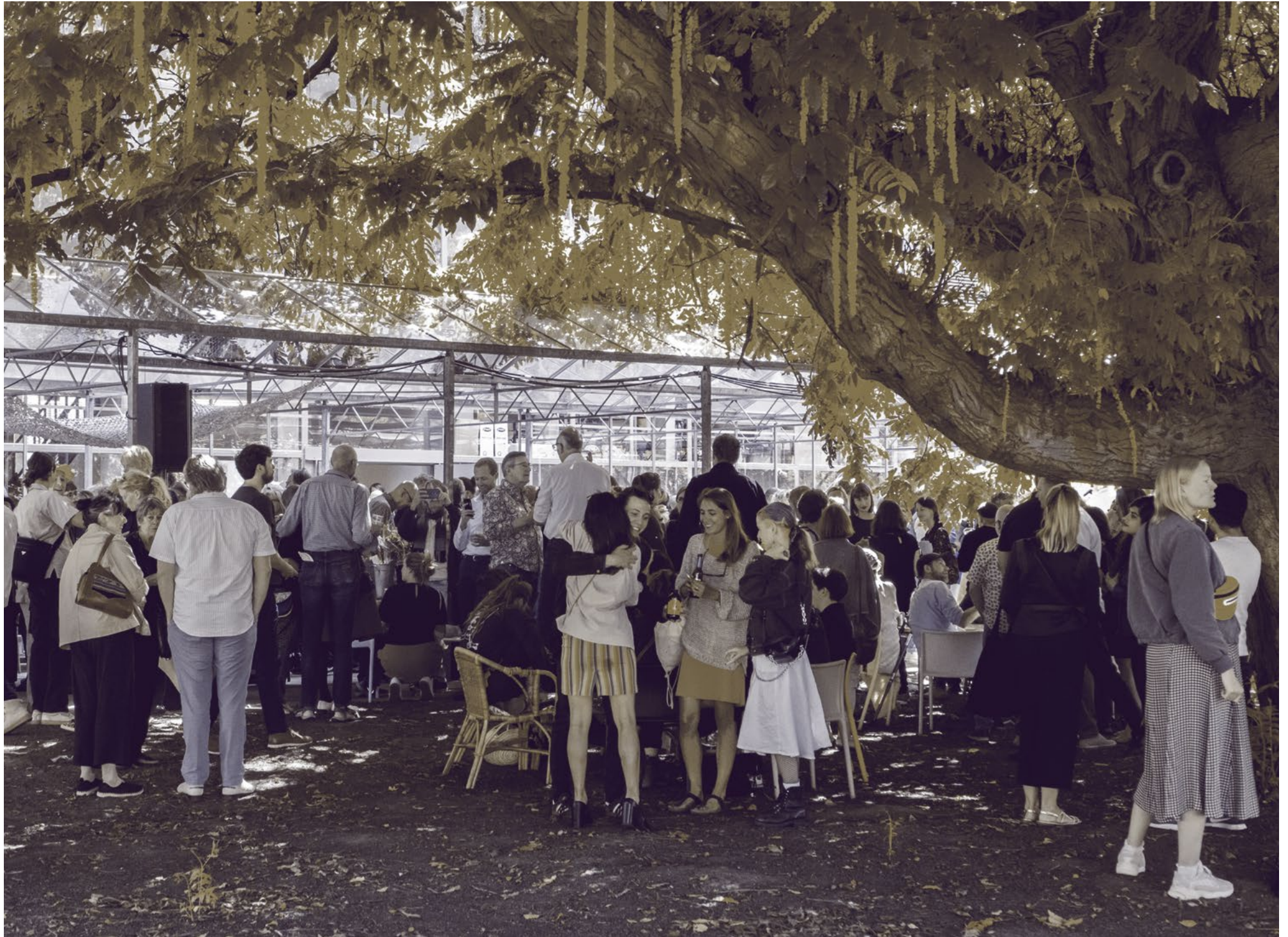
Graduation Opening 2019