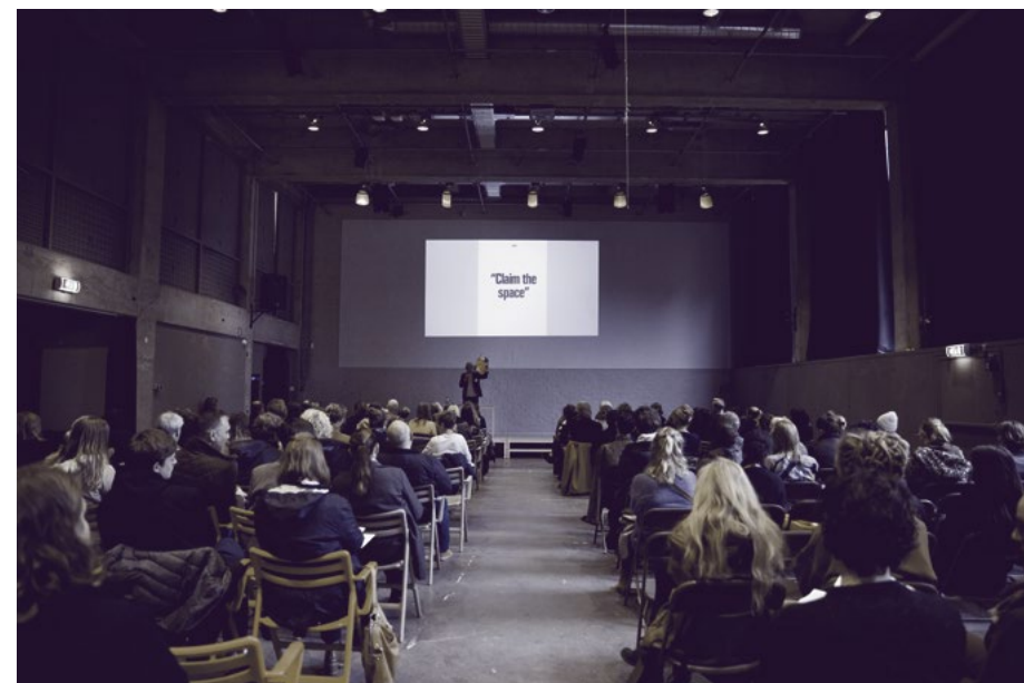
Goedemorgen Gerrit 2018

Onder studenten bestaat behoefte aan samenwerking over de grenzen van hun disciplines heen. Ook is er vraag naar meer praktische experimenten, naar vaardigheden en naar meer begeleiding bij maakprocessen. Er bestaan ideeën voor een practicum generale en afdelingsoverstijgende projecten van wisselende docenten. Onderzoek heeft behoefte aan een plaats waarin het ten dienste van het onderwijs staat. Aan deze uiteenlopende behoeften, die een afdelingsoverstijgend perspectief gemeen hebben, kunnen we beantwoorden door de ruimte tussen de afdelingen beter te benutten en van een programma te voorzien. Het voorstel is van onderop klein te beginnen met de programmering, het aanbod goed te communiceren, geleidelijk uit te breiden en te versterken. Er moet echter altijd ongevulde en onbenoemde tussenruimte blijven, zodat studenten en docenten de mogelijkheid blijven houden zelf initiatief te nemen. Onderzoek op bachelorniveau wordt gepositioneerd in de tussenruimte. Onderzoeksprojecten van docenten krijgen een vervolg in de tussenruimte, of worden daar in studentenprojecten gerealiseerd.