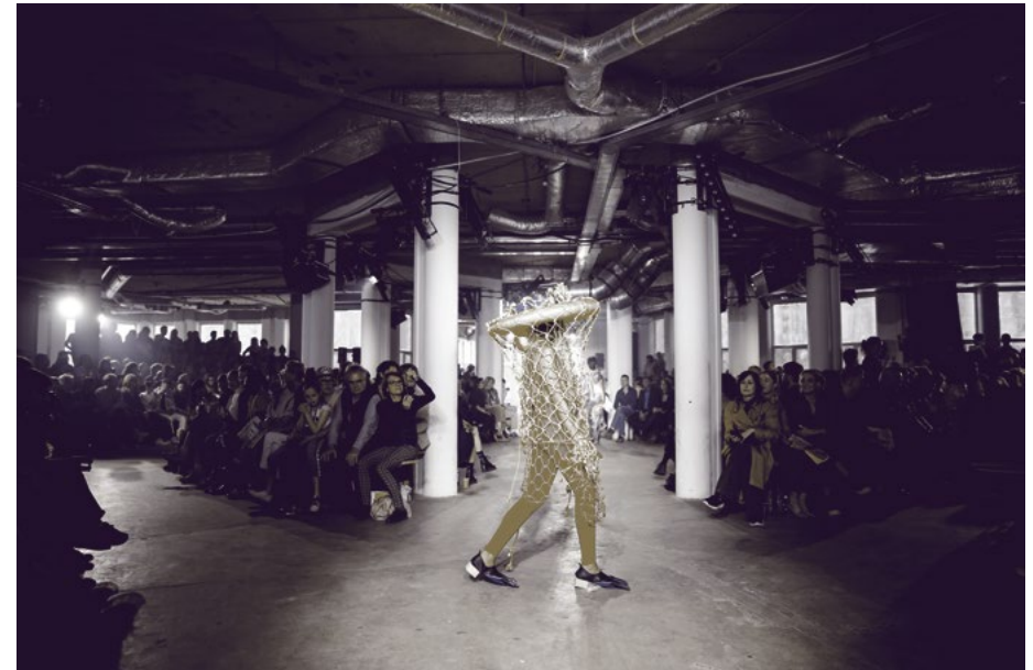
Fashionshow 2019