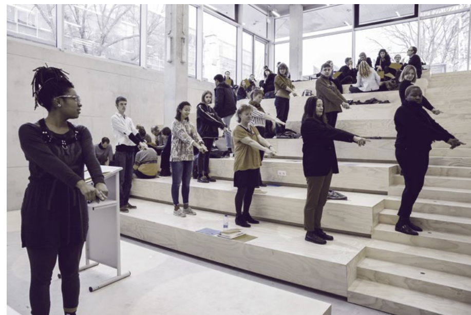
Studium Generale Anniversary Show 2018