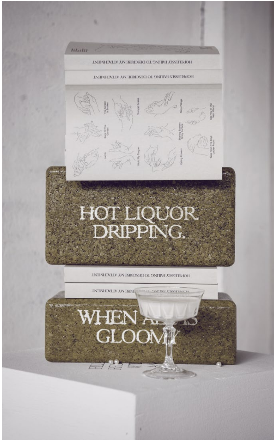
Lucie de Brechard, Stumming at the Rodeo Gardens ; Design, Graduation Show 2019; Studio Spijkerkade.