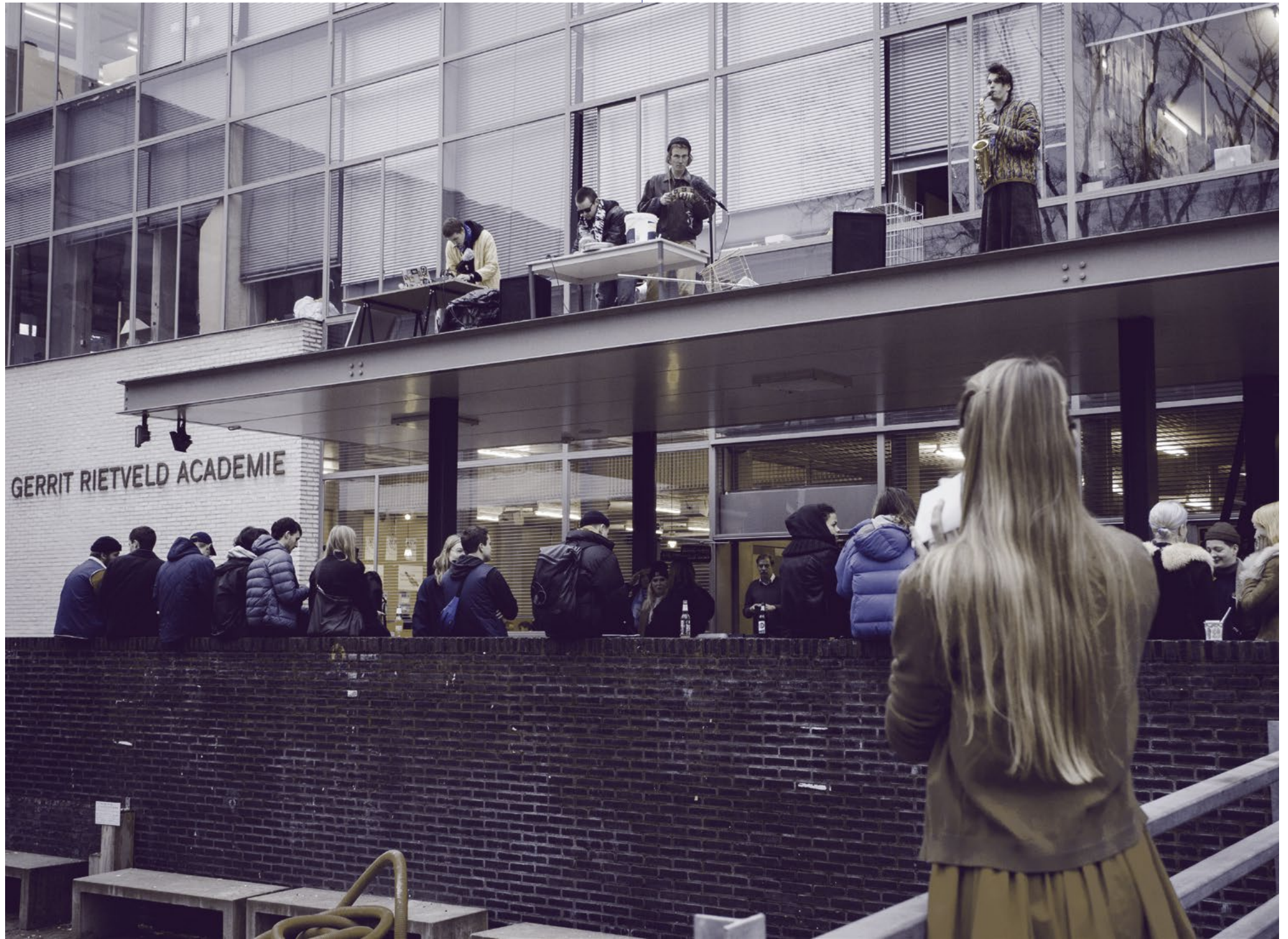
Open Dag, 2019