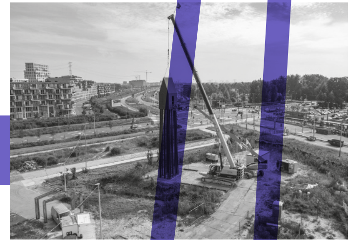
Het Palenhuis (pagina 33-34) is een tijdelijke 'landmark' op de hoek van de Sluisbuurt, werd onthuld in september 2021 en is "een ode aan de oer-Hollandse heipaal." Het kunstwerk werd ontworpen door Piet van Wijk en werd door tweeduizend Amsterdammers gekozen uit een selectie van vijf voorstellen.