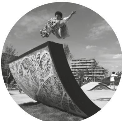
Foto: Skatepark Zeeburgereiland

in de plannen van de gemeente Amsterdam. Maar hoe werken ze in de praktijk? In welke vormen ontstaan gemeenschappelijke acties, welke rol spelen kunstpraktijken hierin en welke lessen kunnen we hieruit trekken? Wij zijn voor Contemporary Commoning in de wijk neergestreken en hebben er veel tijd doorgebracht voor intensief veldwerk.