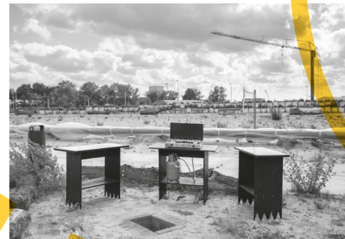
De Kitchen Workshop (pagina 39-40) van kunstenaar Elia Castino is gestationeerd in een tijdelijke keet waar ooit de Sluisbuurt zal staan, en wordt gebruikt voor de publieke bijeenkomsten van het programma voor kunst in de openbare ruimte van de (Nelly &) Theo van Doesburg Stichting.