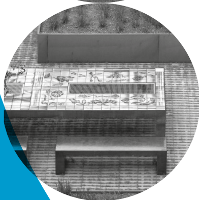
Foto: Table of Contents

Het eerste deel van ons onderzoek richtte zich op de ontwikkeling van het Skatepark en de Urban Sport Zone, een openbare ruimte met een spectaculair ontwerp in het hart van de Sportheldenbuurt. We ontdekten dat er een kloof bestaat tussen ambities op stadsniveau en de daadwerkelijke realiteit in de wijk. De gemeentelijke plannen om uit te proberen of er gezamenlijk een ontwerp gemaakt zou kunnen worden op het Zeeburgereiland liepen uit op standaard manieren van inspraak. Daarbij ontwikkelt de gemeente een plan, legt dat voor aan de betrokkenen of bewoners, en voert het vervolgens uit zonder verder overleg. Ons onderzoek laat daarmee ook zien welke tegenstellingen er spelen bij het ontwikkelen van