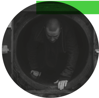
Naar buiten kijken bij Black Water

“De drie enorme silo’s op Zeeburgereiland staan al vijftien jaar leeg. Ze waren van 1982 tot 2006 onderdeel van de rioolwaterzuivering voor heel Amsterdam. ‘Our common shithole’, zoals Rietveld het omschrijft, totdat de rioolwaterzuivering werd verplaatst naar Westpoort. De omgeving, ook wel het baggereiland genoemd, is sindsdien volgezet met nieuwbouw. Het contrast tussen de woonbuurt en de lege en duistere silo is groot. Rietveld: “Als de silo’s nog steeds in een desolate vlakte hadden gestaan, had deze installatie veel minder kracht.”