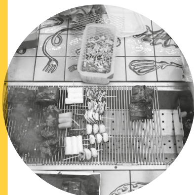
Table of Contents

Koh is onlangs geïnteresseerd geraakt in technieken om materiaal te bedrukken, en deze technieken vormen de basis voor haar kunstwerk Table of Contents , een tafel met handgeschilderde tegels bij het Woon&-complex op het Zeeburgereiland. Het werkt komt voort uit een samenwerking tussen projectontwikkelaar BPD en culturele stichting Theo van Doesburg. Decoratieve elementen op tegels worden al heel lang door beeldend kunstenaars gebruikt om complexe verhalen te vertellen. Het kunstwerk, een gebruiksculptuur in de vorm van een barbecuetafel, introduceert de Koreaanse eetcultuur.