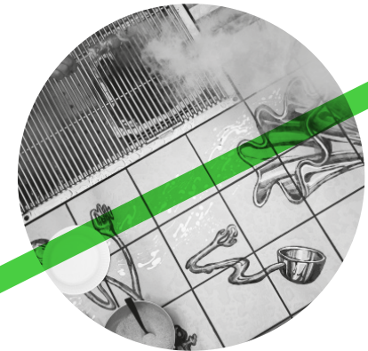
Table of Contents

S0: Ik woon zelf in een dorp en daar is het idee van gemeenschappelijkheid, van commons, heel gewoon. In de stad en zeker in een nieuw stuk stad als het Zeeburgereiland bestaat dat niet meteen. Met Woon& wilden we een bijdrage leveren aan de ontwikkeling van gemeenschappelijkheid, een plek bieden waar mensen elkaar kunnen ontmoeten. Het ontwerp van Bin Koh, de barbecuetafel Table of Contents die nu gerealiseerd is bij het gebouw, draagt daar heel fysiek aan bij. Mensen ontmoeten elkaar bij het samen barbecueën. Het bijzondere kunstwerk dat in samenwerking met Koninklijke Tichelaar Makkum tot stand is gekomen, maakt dat mogelijk, stimuleert dat, en Bin Koh voegt daar de Koreaanse traditie aan toe dat iedereen samen aan het koken is. Het werkt staat of valt natuurlijk met de betrokkenheid van de bewoners, en voor Woon& hebben we nadrukkelijk gezocht naar bewoners die hiervoor open staan en die gemeenschappelijke ruimtes in het gebouw willen gebruiken.