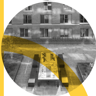
Table of Contents