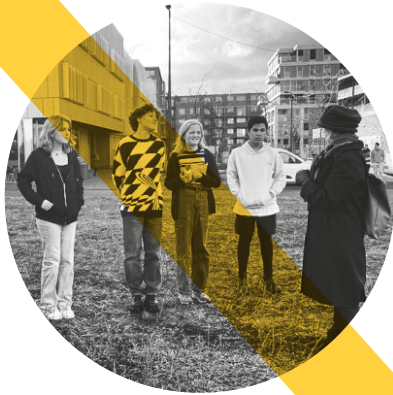
Begeleiding naar de silo

Black Water van RAAAF was een tijdelijke installatie tussen de nieuwbouw op het Zeeburgereiland. Gedurende een paar weken werden bewoners van het eiland uitgenodigd om een reservering te maken voor een bezoek aan de installatie. Om binnen te komen moest je inchecken bij het Nautilus-gebouw en je telefoon achterlaten. Een bewoner-vrijwilliger van het eiland begeleidde je naar de silo en bracht je na afloop terug naar Nautilus, waar je je ervaringen met anderen kon delen. De bedoeling van de installatie was om je in contact te brengen met je basale zintuigen: proberen te zien in het pikzwarte donker, de onvaste grond onder je voeten voelen, de onmetelijk lange echo horen van de druppels op het water die de stilte doorbraken. De geur van zand en water. Afgezonderd van de nieuwe, strak ontworpen bebouwde omgeving van Zeeburgereiland kreeg je toegang tot een gevoel van ruimte en mogelijkheden, werd je teruggeworpen op emoties die je vergeten leek te zijn.