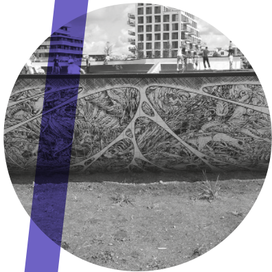
Foto: Stadsparke Zeeburgereiland Foto: WIKIMEDIA Commons/Cescaemel

JvD: Dat vind ik een lastige vraag, als leek op dat gebied. Maar kunst heeft altijd een rol en een doel in de maatschappij, en kan een boodschap overbrengen. Ik heb bijvoorbeeld nog altijd stiekem de hoop om een keer een 'graffiti contest' te houden bij de Urban Sport Zone. Niet op de baan overigens, want dat is niet toegestaan, maar op een mobiele graffiti muur. Graffiti heeft natuurlijk wel een sterke link met 'urban sports'. Kunst kan in die zin complementair zijn. In de gemeente investeren we veel in sport, wat natuurlijk heel goed en belangrijk is, maar kunst blijft vaak een beetje onderbelicht. Daarom maak ik me altijd heel sterk voor kunst in mijn gebied.