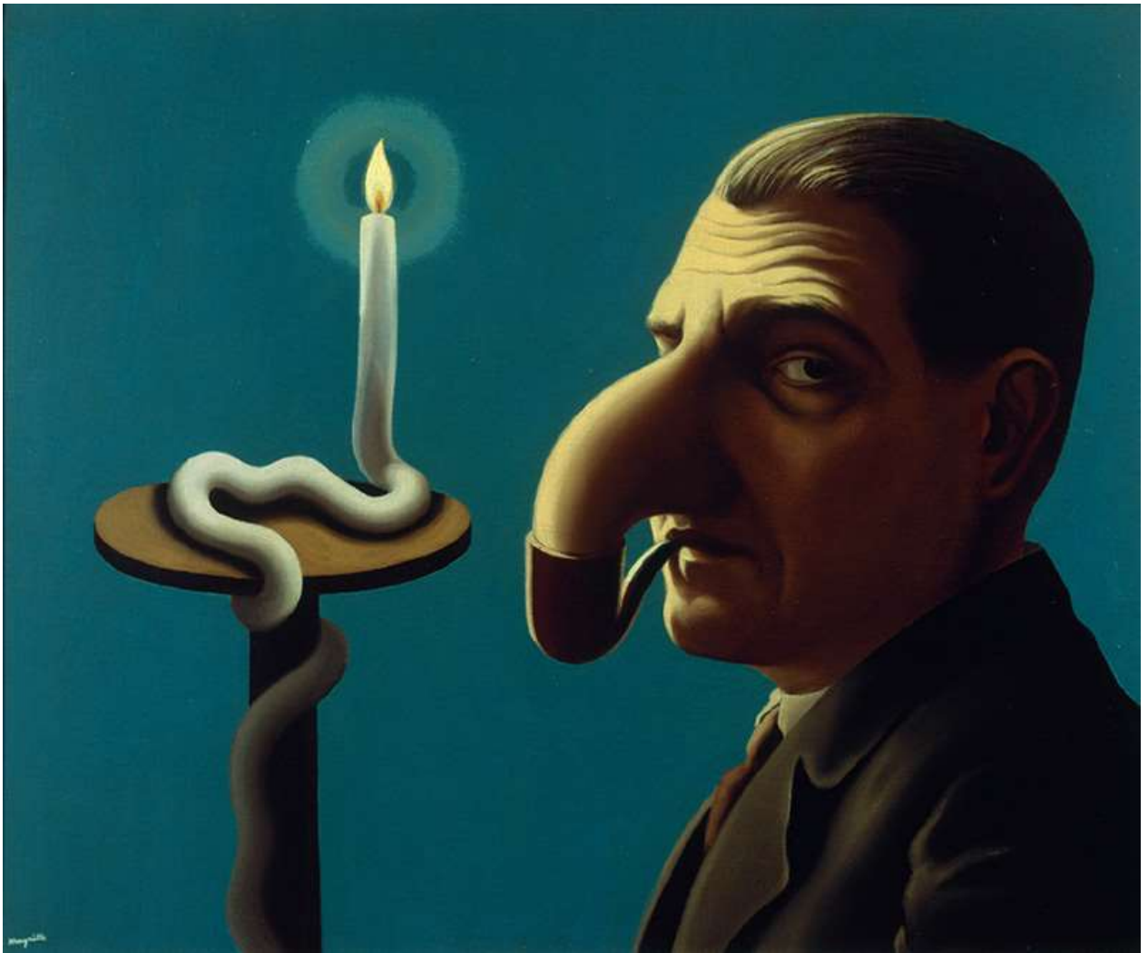
Rene Magritte, La Lampe philosophique , (1936)