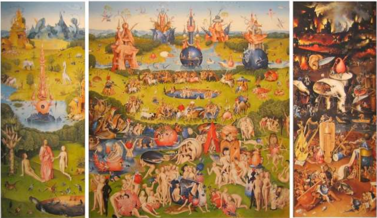
Jheronimus Bosch, Tuin der lusten , (1480-1490)