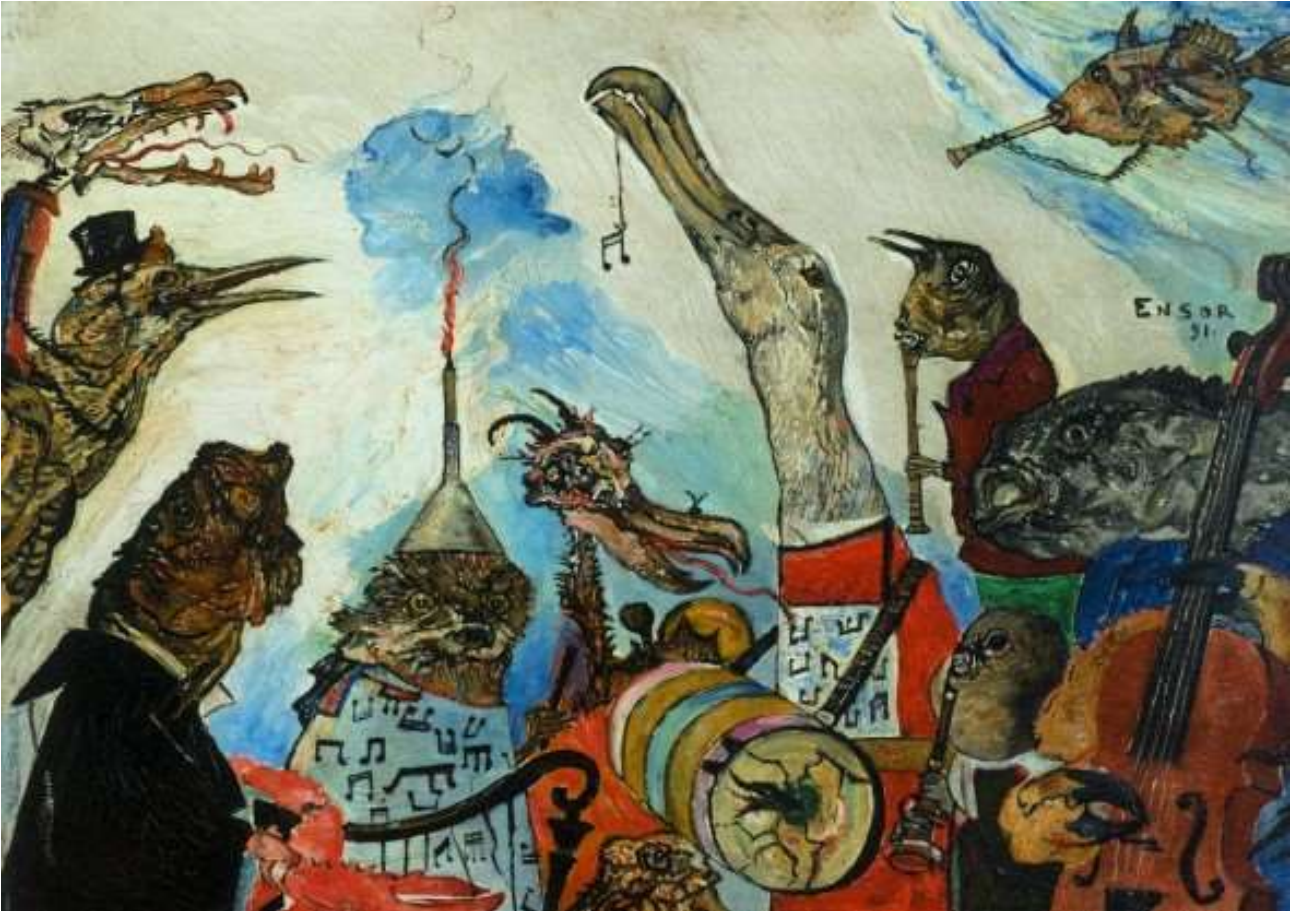
James Ensor, The frightful musicians , (1891)