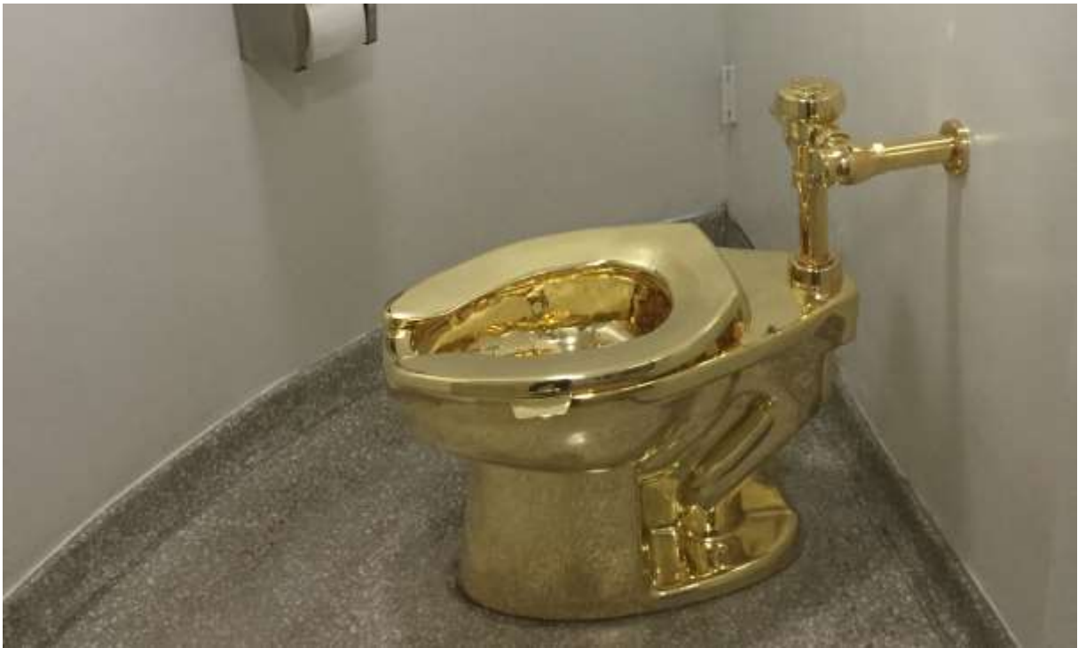
Maurizio Cattelan, America , (2016)