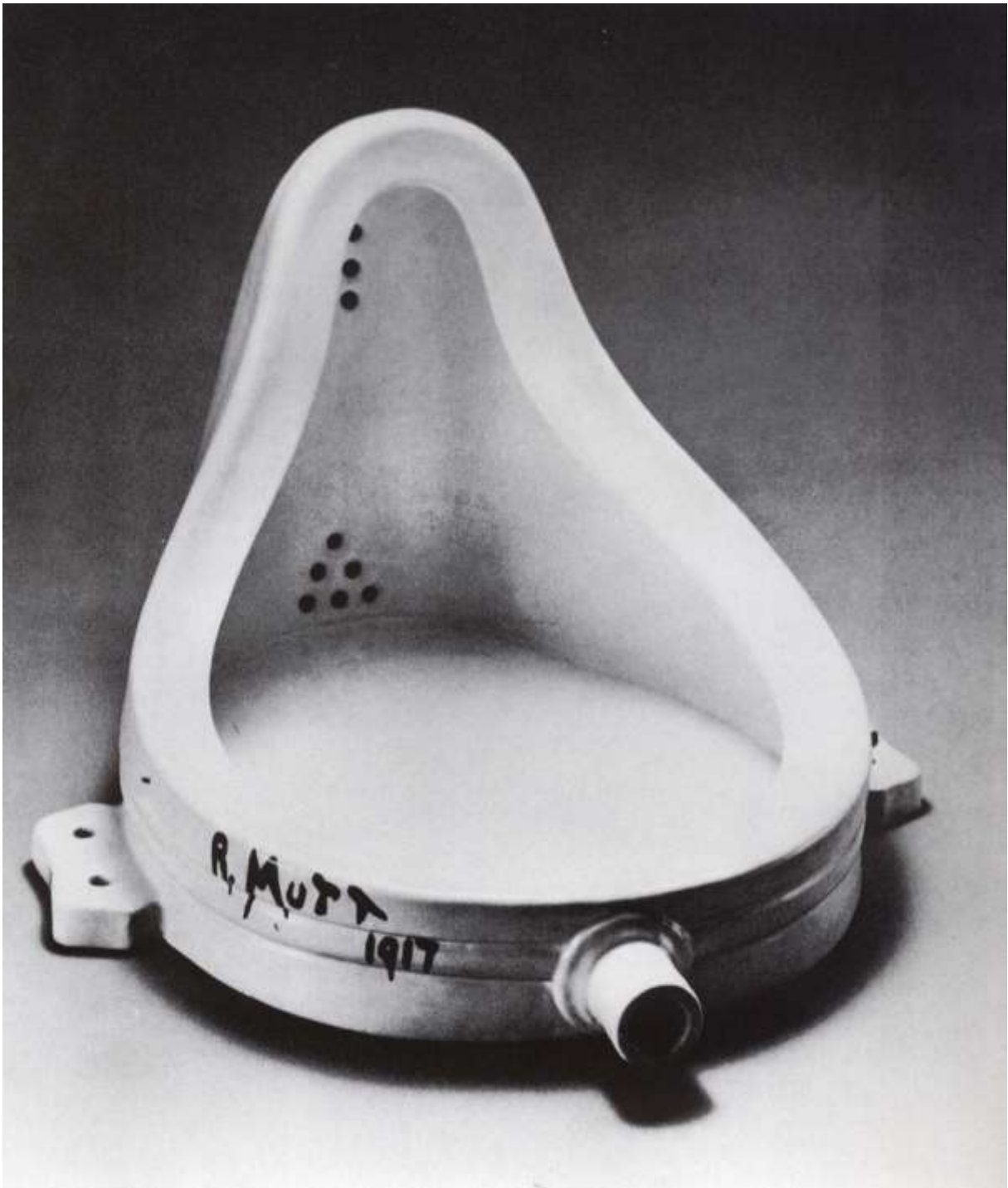
Marcel Duchamp, fontaine , (1917)